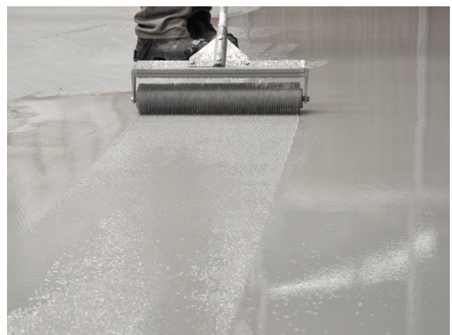
RODILLADO DE FERROPUR MF®