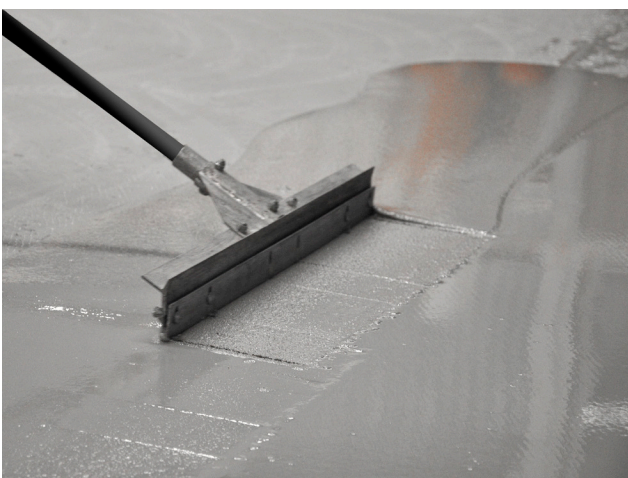
ENRASADO A NIVEL DE FERROPUR MF®

Utilizar los elementos de protección adecuados para la respiración, manos, ojos y piel. Evitar ingerir. Para más información consultar la hoja de seguridad SGA.