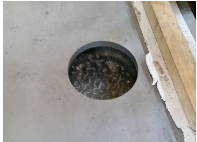
DETALLE SOPORTE ESCARIFICADO Y HÚMEDO