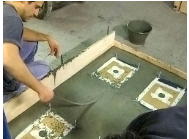
ACOMODAMIENTO DEL GROUT