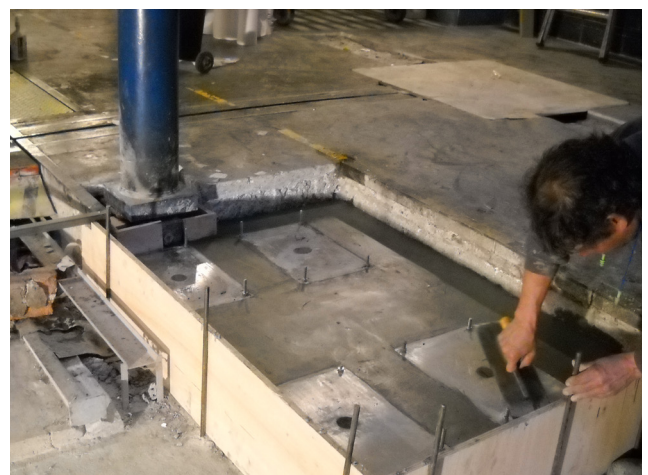
DETALLE DE GROUTING EJECUTADO