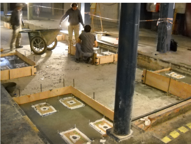
DETALLE DE GROUTING EN BASES DE PRECISIÓN