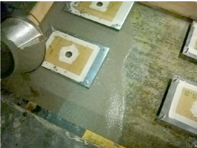
COLADO DE GROUTER E40® BAJO PLACAS