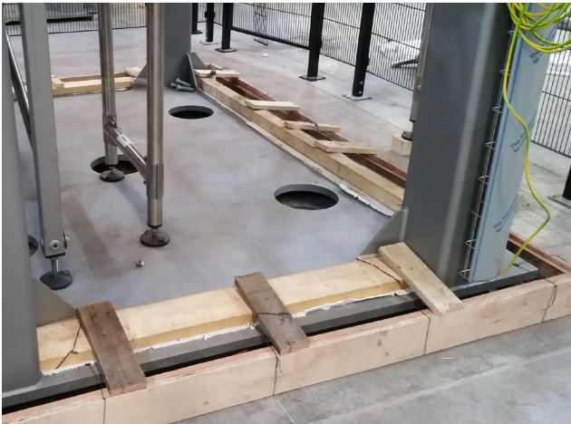
DETALLE DE ENCOFRADO RÍGIDO