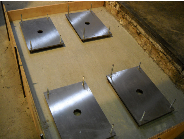
AJUSTE Y NIVELACIÓN DE LAS PLACAS