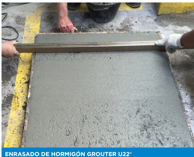
ENRASADO DE HORMIGÓN GROUTER U22®