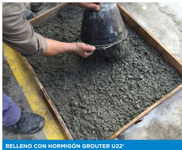
RELLENO CON HORMIGÓN GROUTER U22®