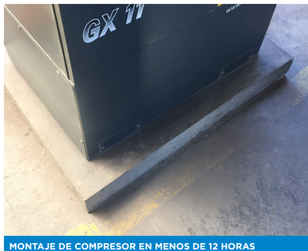
MONTAJE DE COMPRESOR EN MENOS DE 12 HORAS