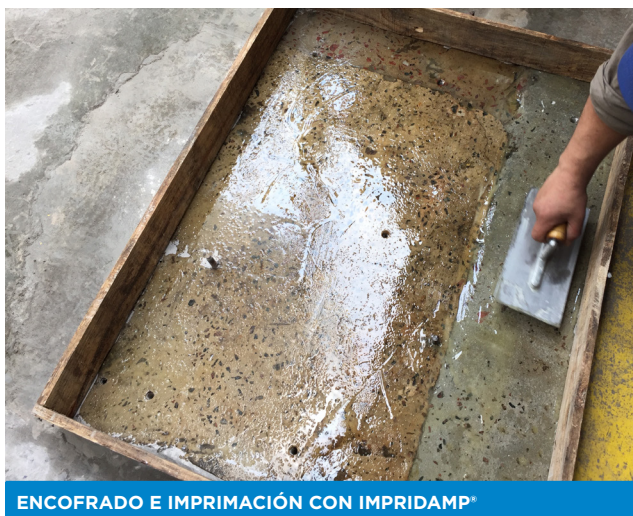
ENCOFRADO E IMPRIMACIÓN CON IMPRIDAMP®