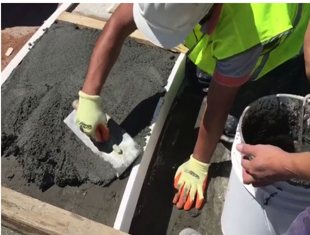
APLICACIÓN DE POLICRET MR® CON LLANA

Utilizar los elementos de protección adecuados para la respiración, manos, ojos y piel. Evitar ingerir. Para más información consultar la hoja de seguridad SGA.